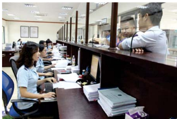
CBCC Hải quan Hữu Nghị hướng dẫn DN làm thủ tục hải quan.

Theo công văn số 610/HQLS-TCCB.Tra, Cục trưởng Cục Hải quan Lạng Sơn đã yêu cầu thủ trưởng các đơn vị thuộc, trực thuộc Cục tăng cường kỷ luật, kỷ cương hành chính.