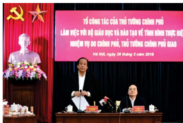
Tổ công tác của Thủ tướng kiểm tra Bộ Giáo dục và Đào tạo.

Thực hiện ý kiến chỉ đạo của Thủ tướng Chính phủ, trong tháng 3/2018, Tổ công tác của Thủ tướng đã kiểm tra Bộ Tư pháp và Bộ Giáo dục và Đào tạo trong việc thực hiện nhiệm vụ giao và việc rà soát, xây dựng phương án đơn giản, cắt giảm hoặc bãi bỏ điều kiện kinh doanh (ĐKKD) không cần thiết, bất hợp lý nhằm tạo môi trường đầu tư, kinh doanh thuận lợi cho người dân và doanh nghiệp.