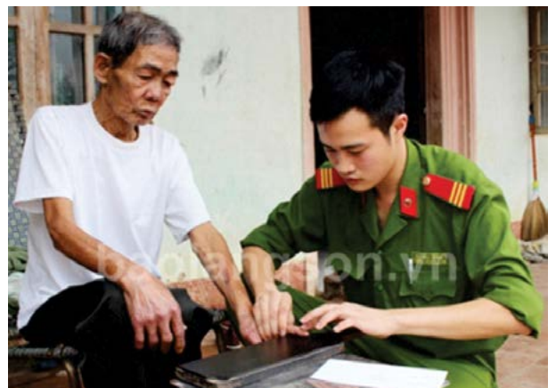
Chiến sỹ công an tới tận nhà để tạo điều kiện cho công dân thực hiện thủ tục cấp chứng minh nhân dân

Hơn 10 năm qua, công an các huyện, thành phố trên địa bàn tỉnh đã tổ chức hàng trăm cuộc tới cơ sở, bao gồm các xã, trường học, đơn vị quân sự nhằm đưa thủ tục hành chính (TTHC) cấp chứng minh nhân dân (CMND) về gần hơn với dân, tạo điều kiện thuận lợi nhất cho công dân thực hiện.