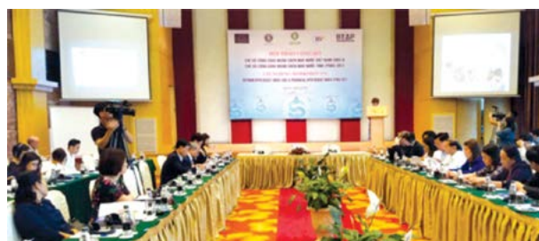
Tàn cảnh hội thảo

Ở trụ cột thứ ba về giám sát, Việt Nam đạt 72/100 điểm đối với giám sát ngân sách của cơ quan lập pháp và 72/100 điểm đối với giám sát ngân sách của cơ quan kiểm toán. Đây là mức điểm cao nhất mà Việt Nam đạt được trong 3 trụ cột.