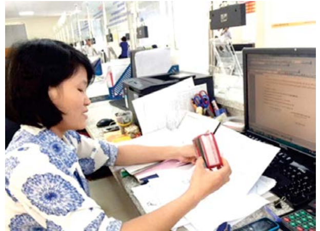
Công tác đối chiếu bản chính bằng con dấu của cán bộ nhận hồ sơ tại UBND quận Gò Vấp

Nghị định quy định rõ các cơ quan, tổ chức khi tiếp nhận bản sao không có chứng thực thì phải yêu cầu người dân xuất trình bản chính để đối chiếu, đồng thời ký xác nhận vào bản sao để xác định tính chính xác.