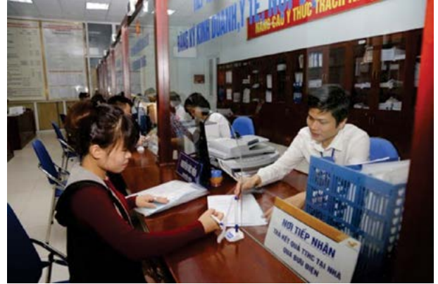
Ảnh chỉ mang tính chất minh họa.

biên chế nhằm đạt mục tiêu giảm biên chế theo chủ trương của Đảng, Quốc hội và Chính phủ.