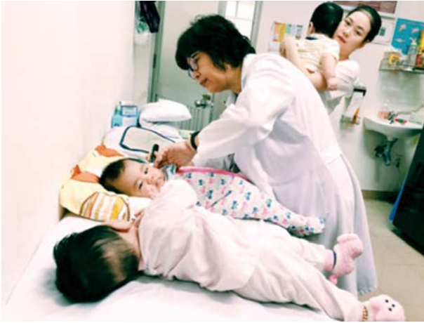
Bác sĩ Bệnh viện Phụ nữ thành phố Đà Nẵng kiểm tra toàn diện sức khỏe trẻ em trước khi tiêm chủng.

BV Phụ nữ thành phố Đà Nẵng, tôi mới quyết tâm đến BV. Nhờ vậy, tôi phát hiện ra mình có khối u ở ngực. Trong quá trình điều trị, nhờ có tiện ích hẹn giờ khám, tôi có thể chủ động về thời gian nên công việc không bị ảnh hưởng gì nhiều”, chị Lâm A. cho biết.