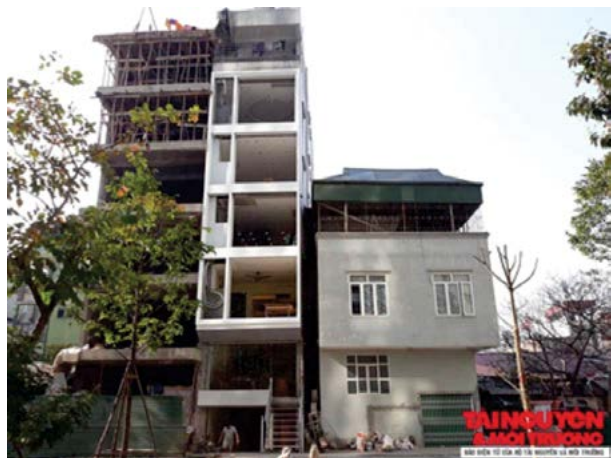
Hà Nội rà soát rút ngắn thời gian cấp phép xây dựng.

cho doanh nghiệp, người dân; áp dụng hình thức kỷ luật nghiêm khắc đối với những trường hợp vi phạm.