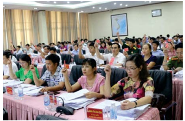
Các đại biểu HĐND tỉnh Lào Cai biểu quyết thông qua Nghị quyết sáp nhập 2 Sở.

UBND tỉnh Lào Cai ban hành quy định vị trí, chức năng, nhiệm vụ, quyền hạn và cơ cấu tổ chức của Sở Giao thông vận tải - Xây dựng sau khi hợp nhất, như vậy là Lào Cai đi tiên phong trong việc sáp nhập hai sở thành một theo đề xuất của Bộ Nội vụ.