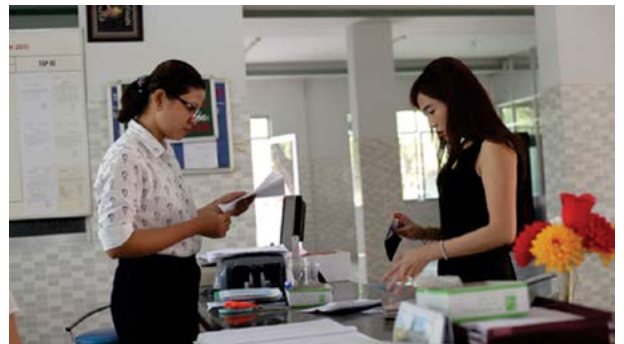
Nhiều nơi, thái độ phục vụ về thủ tục hành chính của cán bộ tư nhân tốt hơn so với cán bộ công

đề nghị giải pháp lắp camera quan sát công việc hằng ngày của cán bộ công chức đối với một số bộ phận nhạy cảm như thuế, tài nguyên môi trường, tư pháp cấp xã...Bởi theo DB Hạnh, thái độ phục vụ của cán bộ công chức một số bộ phận vẫn chưa tốt. DB Hạnh dẫn chứng công chứng tư có thái độ phục vụ tốt hơn nhiều so với công chứng công.