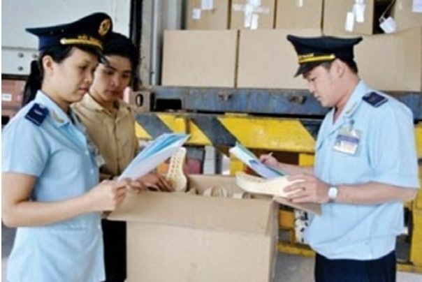
Tăng cường cải cách hoạt động kiểm tra chuyên ngành và cắt giảm, đơn giản hóa điều kiện kinh doanh - Ảnh minh họa

Thủ tướng Chính phủ vừa ban hành Chỉ thị số 20/CT-TTg về tăng cường cải cách hoạt động kiểm tra chuyên ngành và cắt giảm, đơn giản hóa điều kiện kinh doanh.